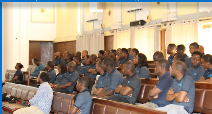
Watumishi wa e-GA wakisikiliza kwa makini mada zilizowasilishwa wakati wa Kikao cha Wafanyakazi