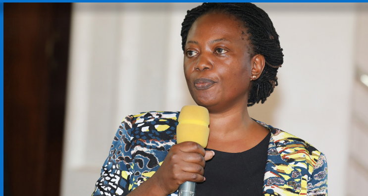
Mwakilishi kutoka Ofisi ya Rais, Menejimenti ya Utumishi wa Umma na Utawala Bora akitoa Mada kwa watumishi wa e-GA wakati wa kikao kazi cha watumishi wa Mamlaka ya Serikali Mtandao tarehe 17 Machi 2023 jijini Dar Es Salaam