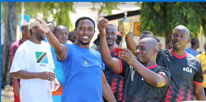
Timu kutoka Kurugenzi ya Huduma na Uwezesaji - (DCS) ikikabidhiwa kombe mara baada ya kushinda kwa kuongoza Ligi kwa jumla ya pointi kumi (10).