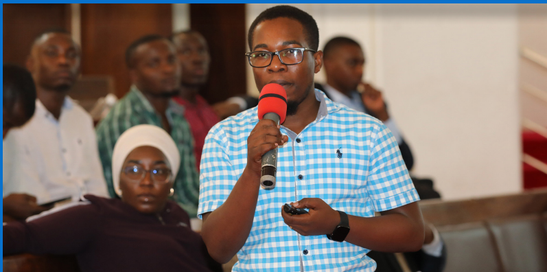
Mwakilishi kutoka Wakala wa Usalama na Afya mahali pa kazi (OSHA) akitoa Mada ya Usalama mahala pa kazi kwa watumishi wa e-GA wakati wa kikao kazi cha watumishi wa Mamlaka ya Serikali Mtandao tarehe 17 Machi 2023 jijini Dar Es Salaam