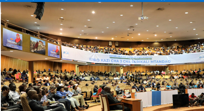
Wadau wa Serikali Mtandao kutoka Taasisi mbalimbali za Umma wakisikiliza kwa makini moja ya mada zilizotolewa wakati wa kikao kazi cha 3 cha Serikali Mtandao kilichofanyika Jijini Arusha kuanzia tarehe 8 - 10 Februari 2023.