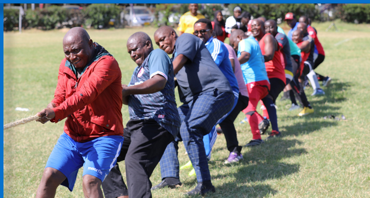
Watumishi kutoka Kurugenzi ya Huduma na Uwezesaji - (DCS) wakivuta kamba na kuibuka washindi