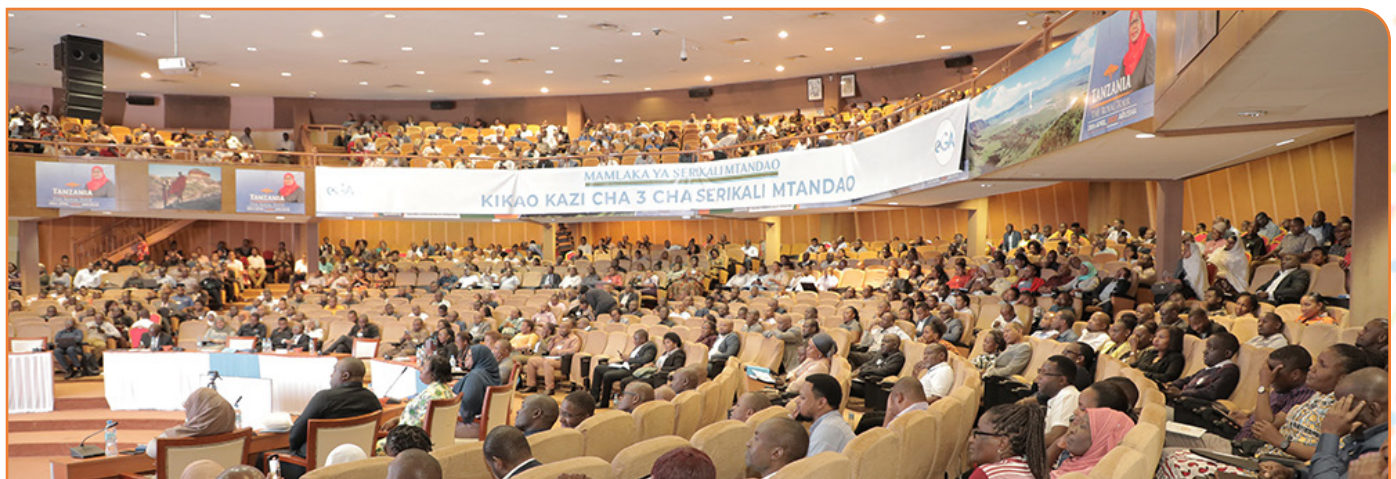
Wadau wa Serikali Mtandao kutoka Taasisi mbalimbali za Umma wakisikiliza kwa makini moja ya mada zilizotolewa wakati wa kikao kazi cha 3 cha Serikali Mtandao kilichofanyika Jijini Arusha kuanzia tarehe 8 - 10 Februari 2023.