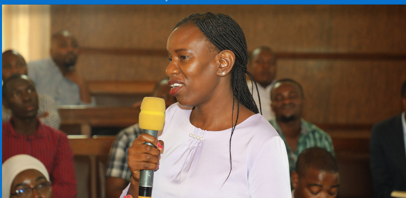
Mwakilishi kutoka Taasisi ya kuzuia na kupambana na Rushwa (TAKUKURU) akitoa Mada ya Rushwa kwa watumishi wa e-GA wakati wa kikao kazi cha watumishi wa Mamlaka ya Serikali Mtandao