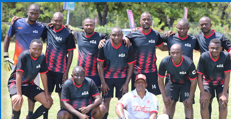
Wachezaji wa Mpira wa Miguu kutoka Kurugenzi ya Huduma na Uwezesaji - (DCS) wakiwa katika picha ya pamoja