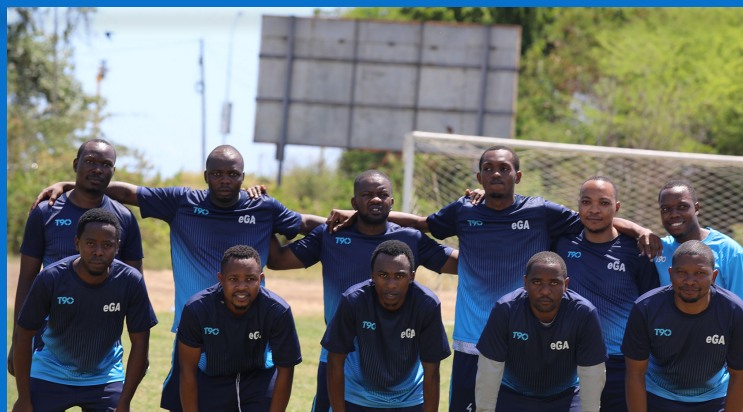
Wachezaji wa Mpira wa Miguu kutoka kurugenzi ya Udhibiti wa Viwango, Miongozo na Usalama wa TEHAMA (DCSM) wakiwa katika picha ya pamoja