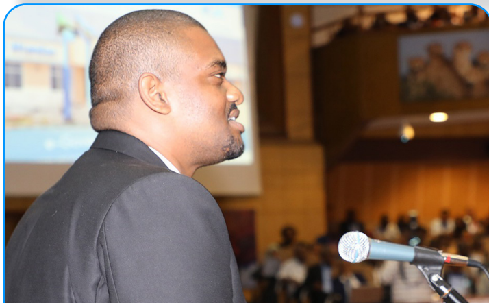
Naibu Waziri Ofisi ya Rais Menejimenti ya Utumishi wa Umma na Utawala Bora Mhe. Deogratus Ndejemi akizungumza wakati wa ufunguzi wa kikao kazi cha 3 cha Serikali Mtandao kilichofanyika Mwezi Februari Jijini Arusha

Naibu Waziri Ofisi ya Rais Menejimenti ya Utumishi wa Umma na Utawala Bora, Mhe. Deogratus Ndejemi (Mb), ameitaka Mamlaka ya Serikali Mtandao (e-GA) kuendelea kufanya utafiti na ubunifu wa Mifumo ya Teknolojia ya Habari na Mawasiliano (TEHAMA) ili kuibua Mifumo itakayosaidia kuimarisha sekta ya viwanda, biashara na uwekezaji ili kuleta maendeleo kwa taifa.