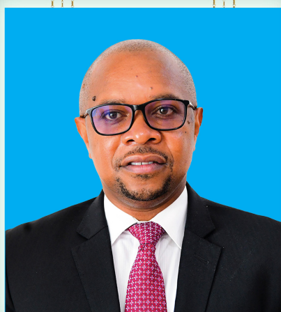
Mhe. Ridhiwan J. Kikwete Naibu Waziri - ORMUUUB

WAZIRI wa Nchi, Ofisi ya Rais Menejimenti ya Utumishi wa Umma na Utawala Bora (ORMUUUB)