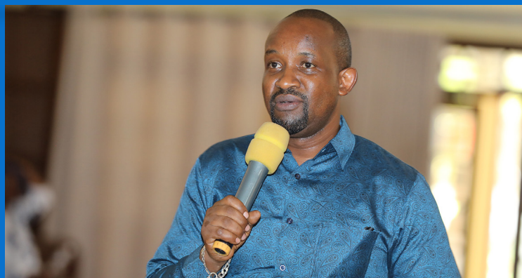
Dkt. Mauki akitoa Mada kwa watumishi wa e-GA wakati wa kikao kazi cha watumishi wa Mamlaka ya Serikali Mtandao tarehe 17 Machi 2023 jijini Dar Es Salaam