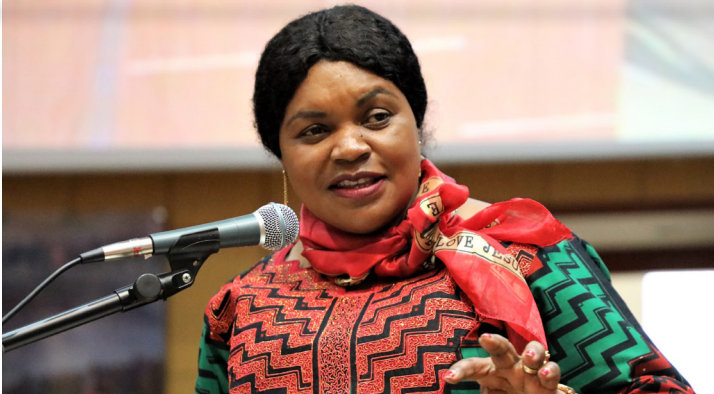
Waziri wa Nchi, Ofisi ya Rais, Menejimenti ya Utumishi wa Umma na Utawala Bora, Mhe. Jenista J Mhagama akizungumza katika kikao kazi cha 3 cha serikali mtandao wakati akifunga kikao kazi hicho jijini Arusha tarehe 10 Februari 2023