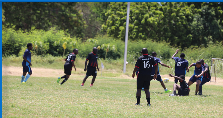
Wachezaji wa Mpira wa Miguu wakiwa katika harakati ya kugombania mpira wakati wa mashindano yaliyojumuisha timu kutoka Kurugenzi mbalimbali za Mamlaka ya Serikali Mtandao