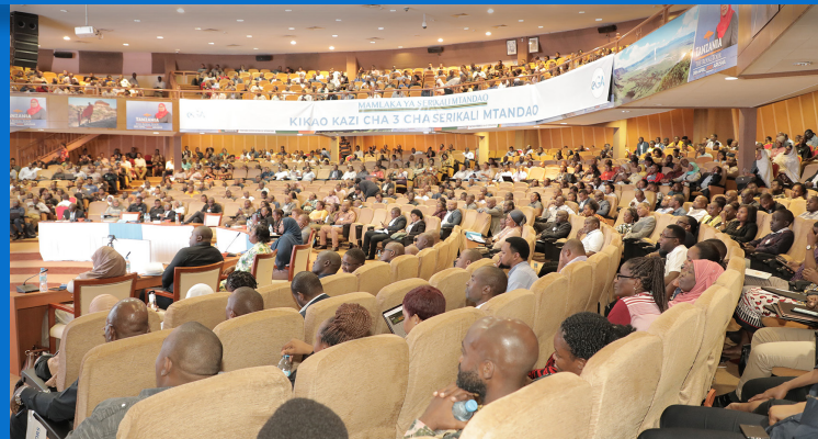
Wadau wa Serikali Mtandao kutoka Taasisi mbalimbali za Umma wakisikiliza kwa makini moja ya mada zilizotolewa wakati wa kikao kazi cha 3 cha Serikali Mtandao kilichofanyika Jijini Arusha kuanzia tarehe 8 - 10 Februari 2023.