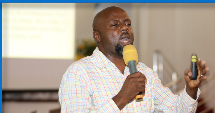
Bw. Mosses akitoa Mada kwa watumishi wa e-GA wakati wa kikao kazi cha watumishi wa Mamlaka ya Serikali Mtandao tarehe 17 Machi 2023 jijini Dar Es Salaam