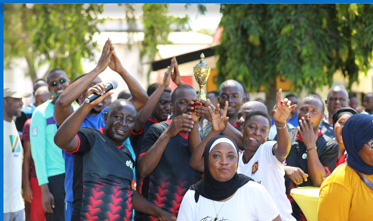
Watumishi kutoka Kurugenzi ya Huduma na Uwezesaji - (DCS) ikishangilia kombe la ushindi