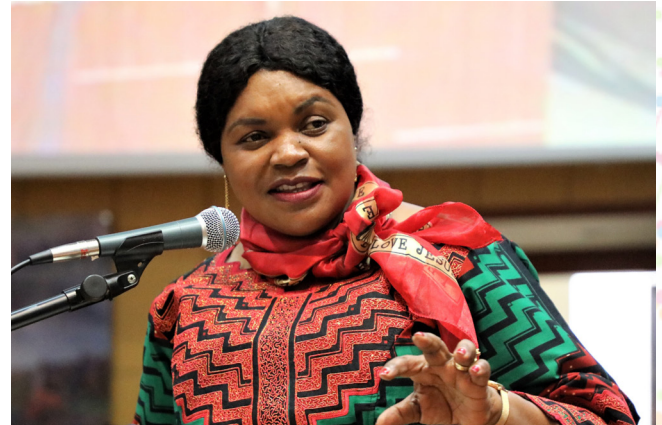
Waziri wa Nchi Ofisi ya Rais-Menejimenti ya Utumishi wa Umma na Utawala Bora Mhe. Jenista Mhagama (Mb) akizungumza wakati wa Kikao kazi cha 3 cha Serikali Mtandao Februari 10, 2023

Mada hizo zilihusu namna ambavyo Taasisi hizo zimekuwa zikitekeleza jitihada za Serikali Mtandao kwa kushirikiana na Mamlaka ya Serikali Mtandao (e-GA).